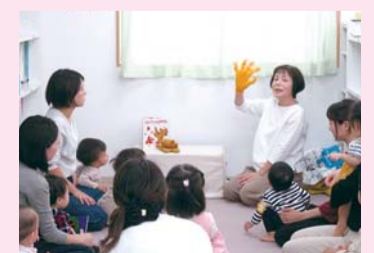
手袋人形登場で、親子で楽しいお話し会

絵本を貸し出しています。 1回につき、1人3冊、2週間以内に返却 📅月~金 9時30分~11時30分