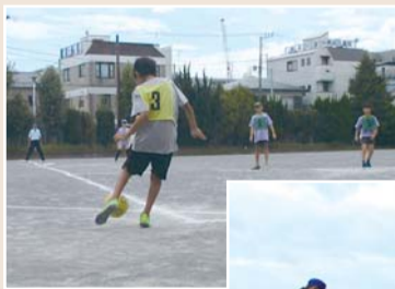
キックベースボール