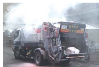
危険ごみの混入が原因で起きた車両火災

燃やすごみの中に混入された「充電式電池・ライター・スプレー缶」が原因と思われる、収集車の火災事故が発生しています。火災の影響は車だけでなく、大きな事故につながる恐れがあります。