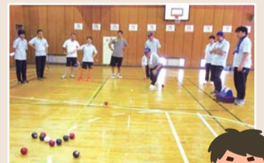
地上のカーリングとも呼ばれています

誰でも気軽に楽しめる新スポーツ「ボッチャ」。みなさんに体験してもらうために、委員内で研修会を実施しています